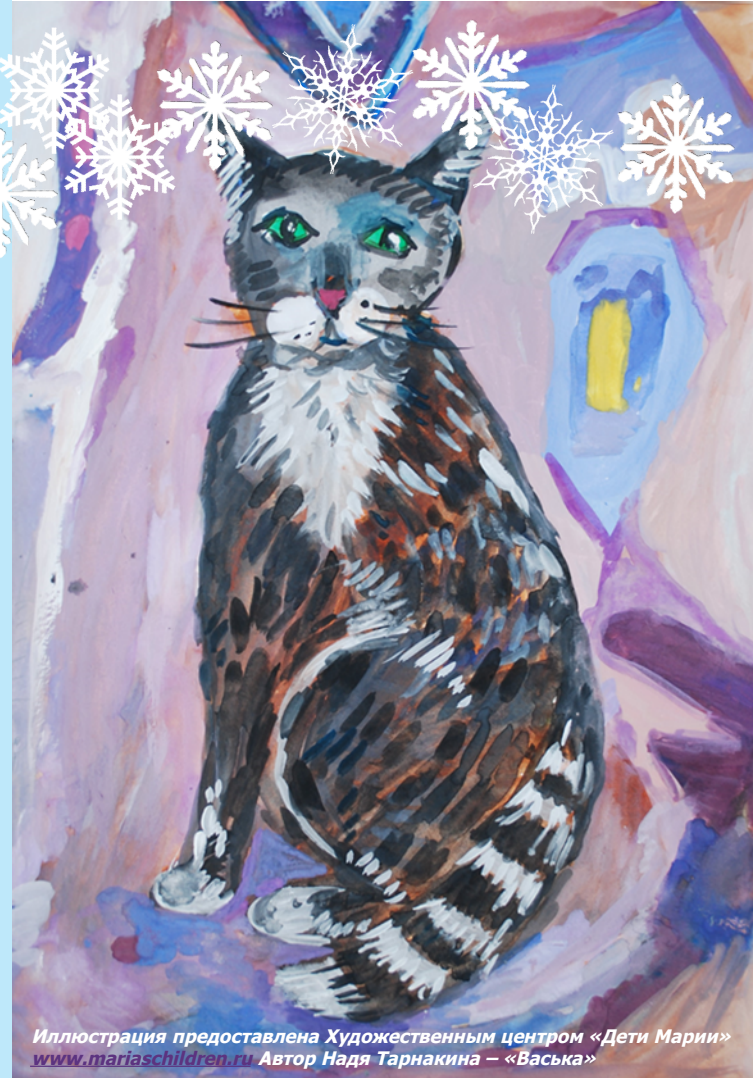
Иллюстрация предоставлена Художественным центром «Дети Марии» www.mariashildren.ru Автор Надя Тарнакина – «Васька»